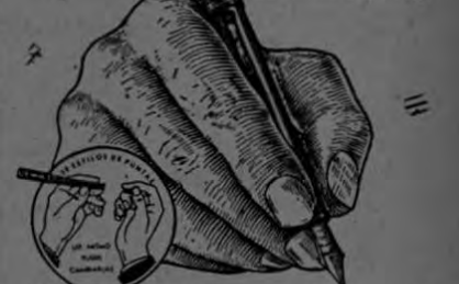
En una Pluma Fuente

sólo la punta exacta le da placer de escribir.