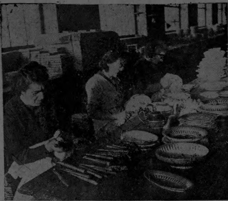
¿Quién no ha oído hablar de la maravillosa porcelana de Limoges? Fina, transparente, de gusto exquisito, goza en Europa y en todo el mundo de una fama bien merecida. Obreras, mejor dicho verdaderas artistas, se dedican con esmero a la delicada operación de dibujar y pintar porcelanas recién sacadas del horno. (SIF).