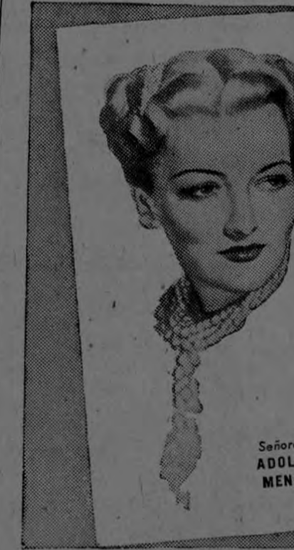
Señora de ADOLPHE MENJOU