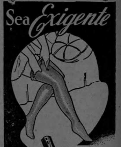
En cuestión de medidas el tamaño exacto da comodidad...

Como sus madres, las jóvenes (Pasa a la pág. OCHO)