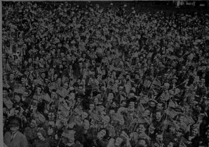
Obreros de Filadelfia en una ceremonia del Día de la Bandera.

WASHINGTON.—En el texto de su proclama para la celebración del Día de la Bandera el catorce de junio, el Presidente Truman manifestó que los ciudadanos deben consagrarse una vez más al espíritu del pabellón nacional, al cumplirse el primer año después de las más importantes victorias alcanzadas por los Estados Unidos y sus aliados en los campos de batalla durante la Segunda Guerra Mundial. Mr. Truman también exhortó al pueblo a que, como otra prueba de reconocimiento por las victorias logradas en conjunto por la república y sus aliados, se enarbolen los pabellones de las Naciones Unidas para que ondeen al lado del de los Estados Unidos. De igual manera, en 1942, el Presidente Franklin D. Roosevelt exhortó al pueblo estadounidense a rendir homenaje, en el Día de la Bandera, no solamente a la de los Estados Unidos, sino también a las de todas las Naciones Unidas. Así, pues, lo que antes era una celebración puramente nacional, ahora incluye un tributo de honor a todos los enemigos de las agresiones. Woodrow Wilson, en su proclama del Día de la Bandera, en 1917, dos meses después de la declaración de guerra de los Estados Unidos a Alemania, se refirió a lo que significa ese día, expresándose en los siguientes términos: "Pronto llevaremos nuestra bandera a los campos de batalla, enarbolarla en donde atraerá