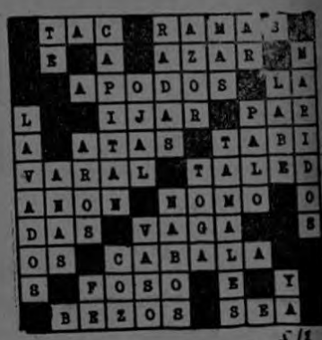
Solución del Crucigrama Nº 34

Ve la solución de este crucigrama Nº 34 en nuestra próxima edición.